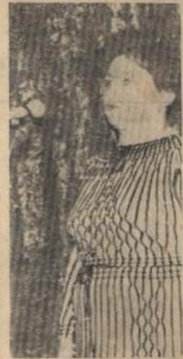
ми «Люблю тебя, моя Россия», «Уральский пашкрай».