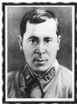
ДЖАЛИЛЬ Муса Мустафович (1906 - 1944)

Советский татарский поэт и журналист, военный корреспондент. Герой Советского Союза, Лауреат Ленинской премии. Член ВКП с 1929 года. В первый же день войны добровольцем ушёл в ряды действующей армии. В июне 1942 г. на Волховском фронте был тяжело ранен и взят в плен. В концлагере вёл активную подпольную работу, за что был брошен в фашистскую тюрьму