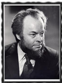
ОРЛОВ Сергей Сергеевич (1921 - 1977)

Русский советский поэт и сценарист. В 1941 году ушёл добровольцем в действующую армию. Сначала служил в истребительном батальоне, затем в танковых частях. Окончил танковое училище. В качестве командира танка, а затем командира взвода тяжёлых танков воевал на Волховском и Ленинградском фронтах. Был тяжело ранен, горел в танке. Награждён орденом