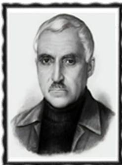
СИМОНОВ Константин Михайлович (1915 - 1979)

Война была для них, вчерашних школьников и студентов, крутым и досрочным началом «взрослой» жизни. В эти свинцовые годы сформировался их талант, определился характер творчества. Почти все они прошли войну солдатами и офицерами переднего края. Каждое стихотворение как моментальный снимок застигнутой врасплох войны.