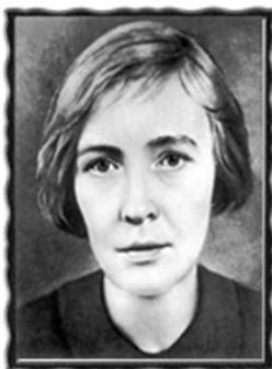
БЕРГГОЛЬЦ Ольга Фёдоровна (1910 - 1975)

Говорят, у войны не женское лицо, но женщины уходили на фронт. Они помогали раненым, подносили снаряды, они были снайперами, лётчицами... они были солдатами. Слово их тоже было оружием. Анна Ахматова, Ольга Берггольц... Их стихи знали, ждали...