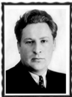
ФАТЬЯНОВ Алексей Иванович (1919 - 1959)

Советский русский поэт, автор многих популярных в 1940-1970-х годах песен.