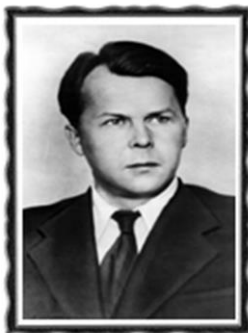
ТВАРДОВСКИЙ Александр Трифонович (1910 - 1971)

Поэт, журналист. Во время Великой Отечественной войны работал военным корреспондентом во фронтовых газетах. Публиковал в них стихи и очерки. В рядах армии он изведаль и горечь долгого отступления, и дорого доставшееся торжество наступления и победы. Поэму «Василий Тёркин» Твардовский писал в походе, отрывки печатались во фронтовых газетах. «Книга про бойца» получила всенародное признание.