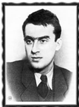
ГУДЗЕНКО Семён Петрович (1922 - 1953)

Украинский советский поэт и журналист, военный корреспондент.