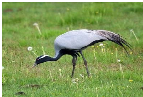
Журавль - красавка