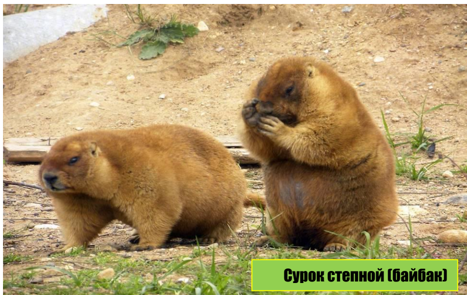
Сурок степной (байбак)

Относительное однообразие ландшафтных условий Таловской степи обусловило формирование здесь устойчивого степного зоокомплекса с небольшим количеством видов. На участке обитают 17 видов млекопитающих. Из них наиболее характерны норные грызуны: сурок степной, пеструшка степная, суслик малый, тушканчик большой.