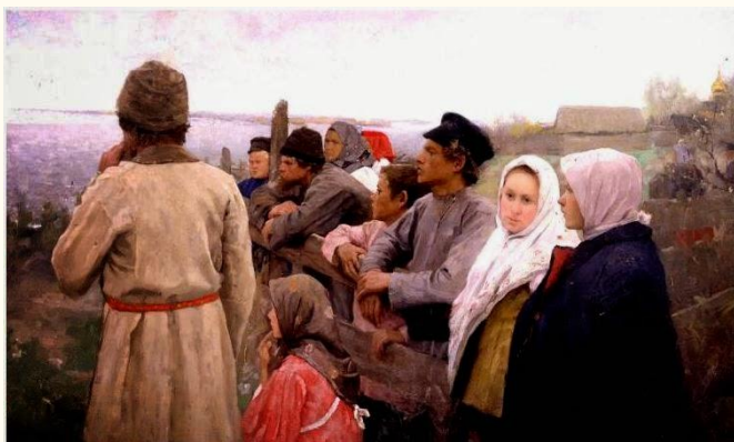
Л.В. Попов. «Луга затопило», 1908 г. Холст, масло. Оренбургский областной музей изобразительных искусств