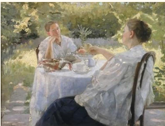
Л.В. Попов. «В саду (Чаепитие)», 1911 г. Холст, масло. Оренбургский областной музей изобразительных искусств