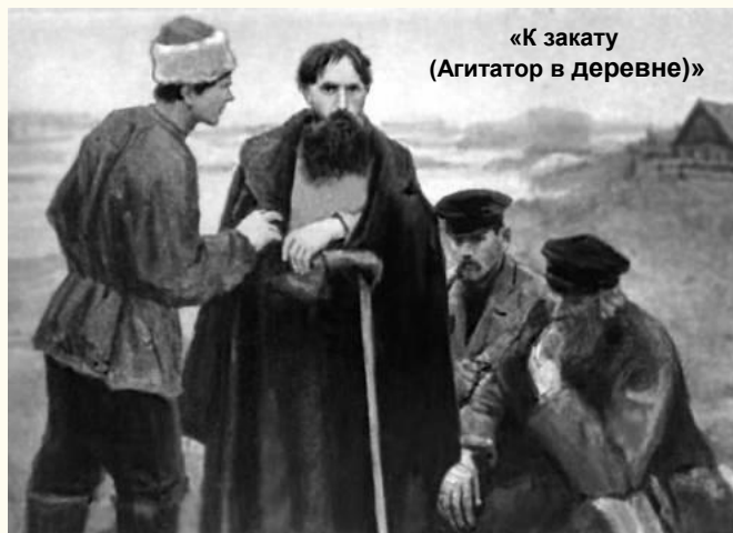
«К закату (Агитатор в деревне)»